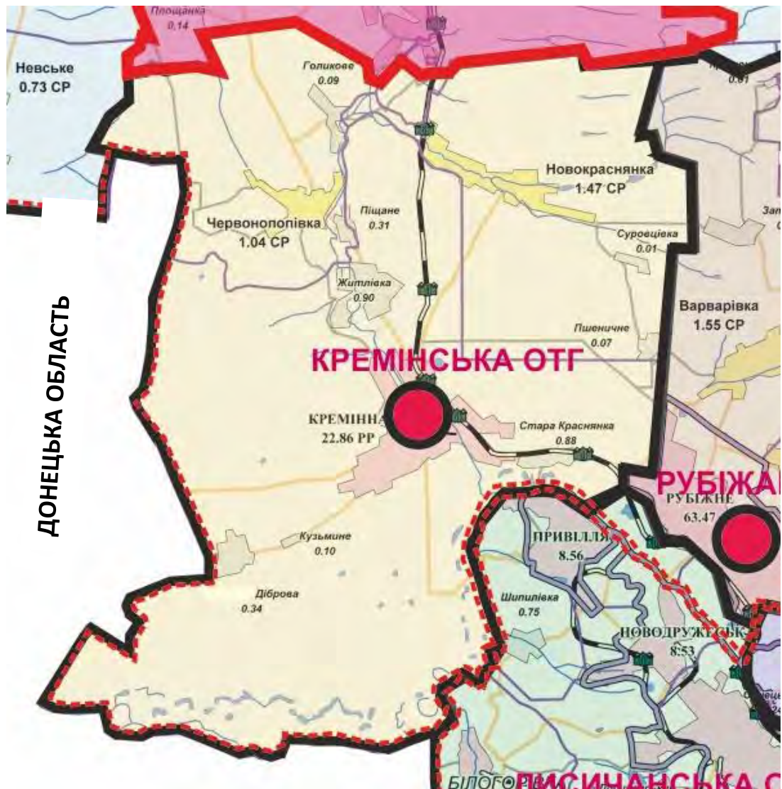
Рис. 1 Адміністративна карта Кремінської перспективної ОТГ