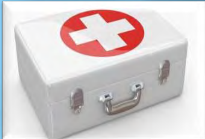
Лікарські та медичні засоби