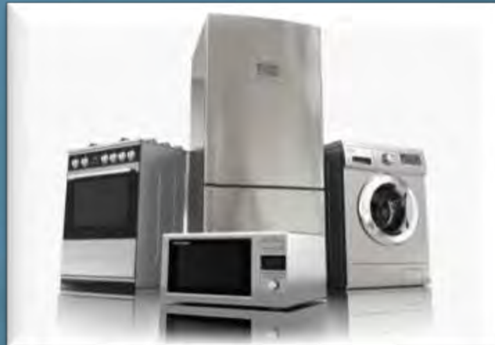
Складна побутова техніка

З 1 січня 2021 обов'язкове застосування РРО