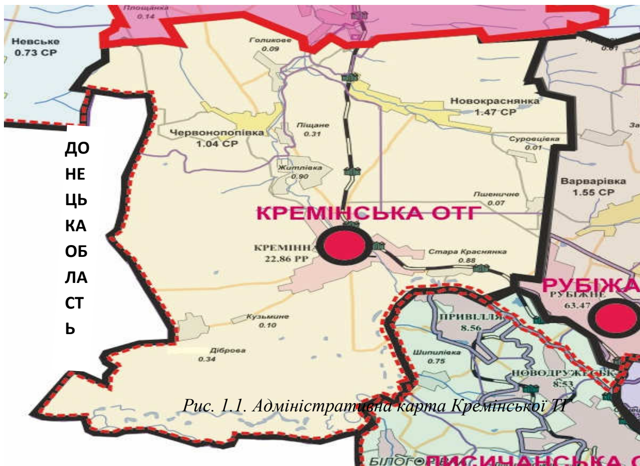
Рис. 1.1. Адміністративна карта Кременської ТГ

Кременська ТГ розташована на заході Луганської області та межує з Донецькою областю.